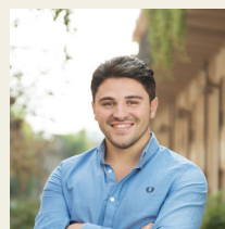
Victor Ranieri GM Italy